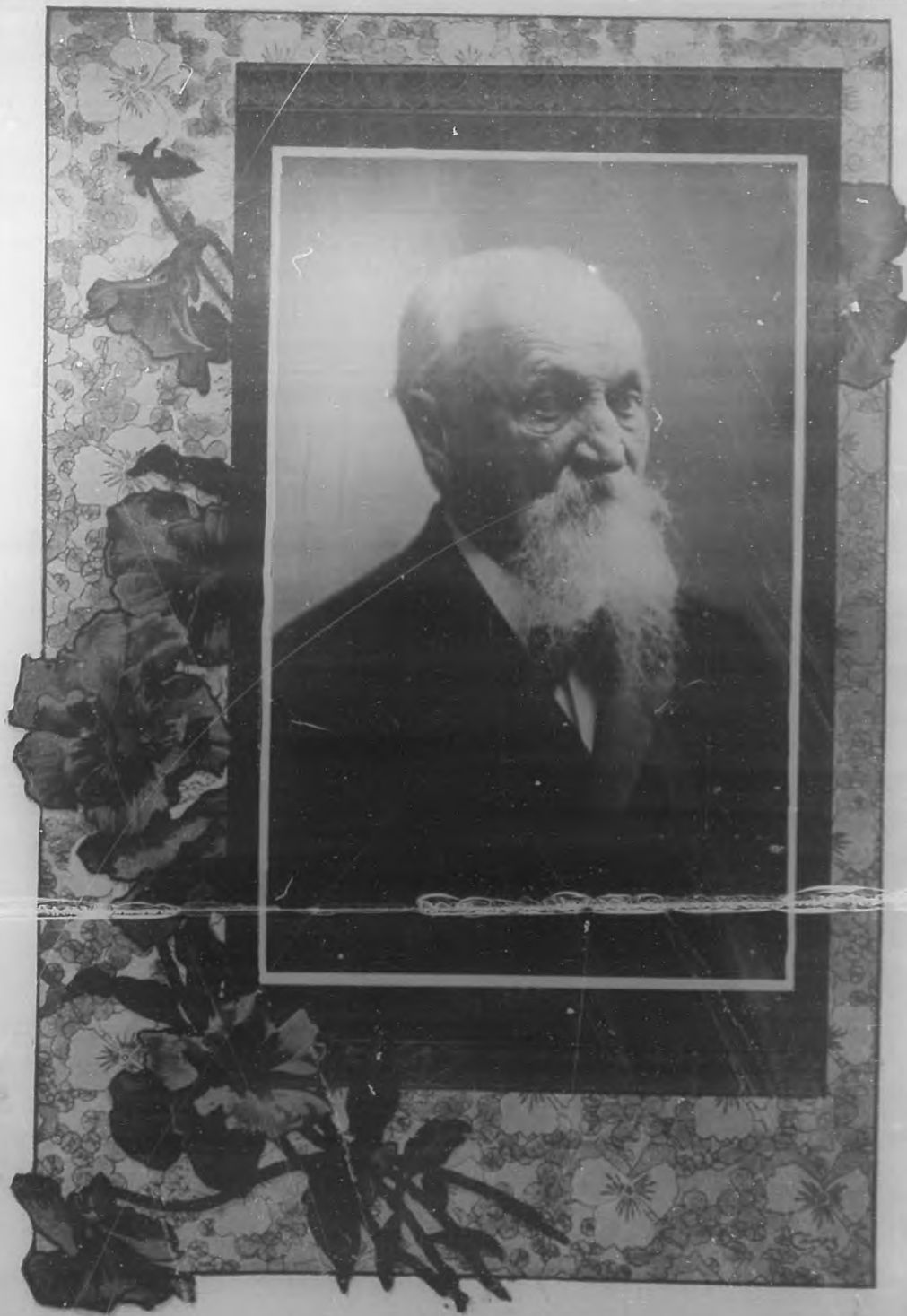
† SALVADOR CISNEROS BETANCOURT