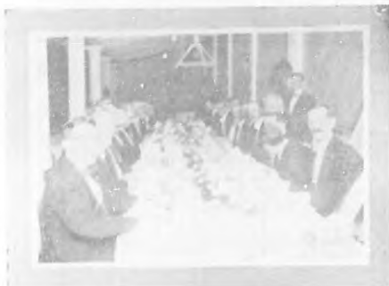
Aspecto del banquete ofrecido al Sub-secretario de Estado por el Cuerpo Consular acreditado en la Habana, la noche del jueves 5 de los corrientes.