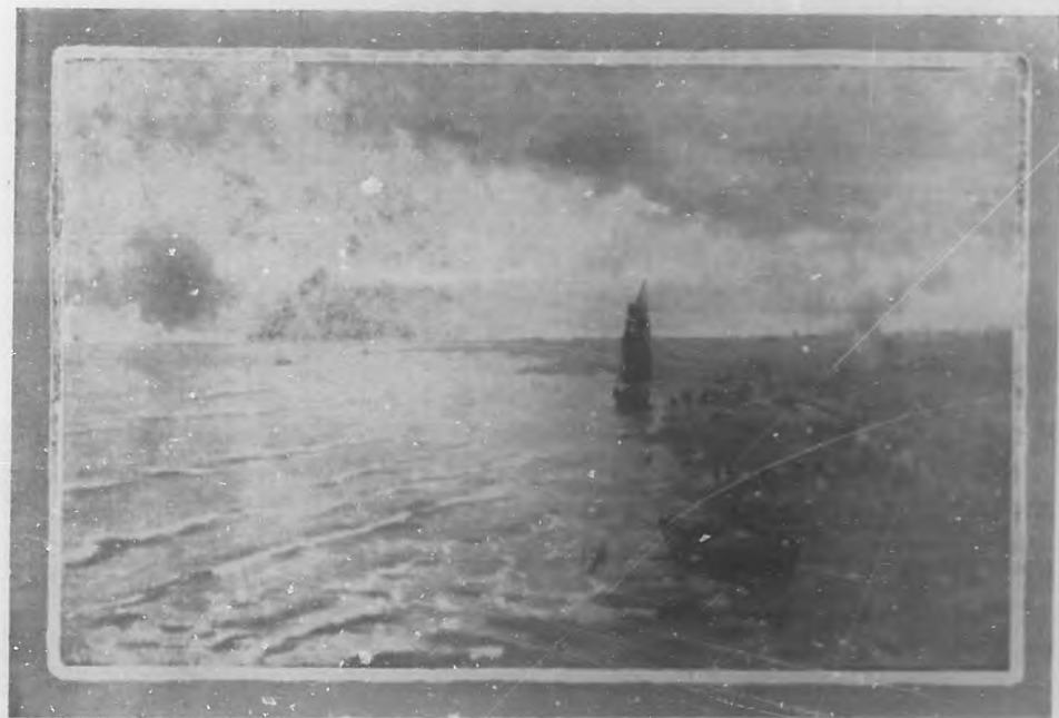
MARINA. Cuadro de Filippo Carcano.

Esta coincidencia de las dos muertes, acaecidas en la plenitud de la edad, después de una larga existencia tiernamente convivi-