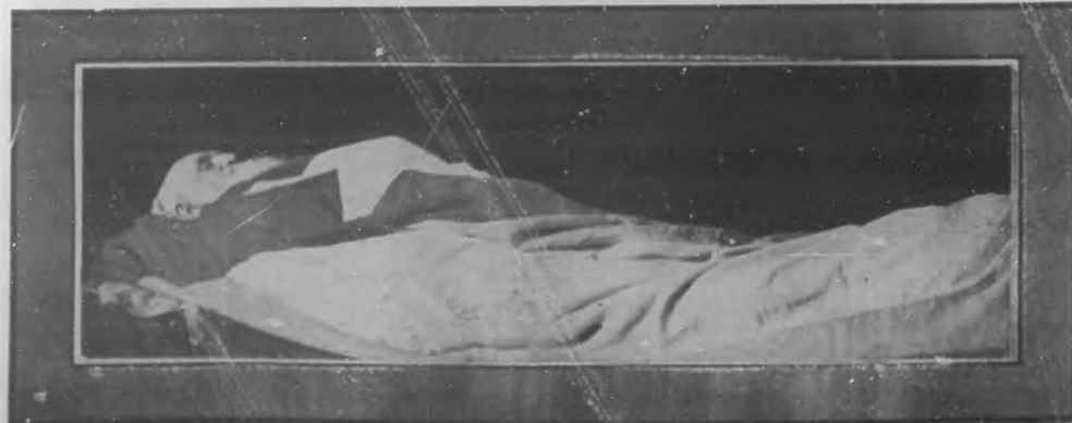
Salvador Cisneros Betancourt, Marqués de Santa Lucía en su lecho de muerte.