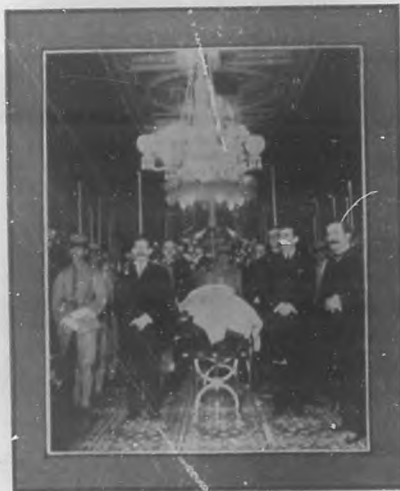
LOS FUNERALES DEL MARQUES DE SANTA LUCIA Primera guardia de honor (1907) a órdenes de las clases del Ayuntamiento habanero, en la capilla levantada en el Salón Azul del Palacio de la Presidencia.

Si esto no fuera una verdad indiscutible, es indudable que, al terminarse la guerra de independencia, las clases directoras del pueblo de Cuba tuvieron oportunidad para demostrar su respeto y su admiración a los grandes hombres revolucionarios; y es evidente que, en ese período, eran dos los prohombres que estaban en primera fila, y se encontraban reconocidamente capacitados por su civismo para ser elevados a la suprema Magistratura de la República: el Sr. Salvador Cisneros Betancourt que fue Presidente en las grandes contiendas legendarias de 1868 y 1895 y cuya vida y figura deben servir de perdurable ejemplo, según la grática expresión de un filósofo, y el Sr. Bartolomé Maso, cuyas victorias han sido siempre desconocidas, con tanta más razón, cuanto que, en el orden político, la nueva situación que se creaba por el derrumbe de la soberanía española en Cuba, debía estimarse como derivación formal del anterior período revolucionario en el cual el General